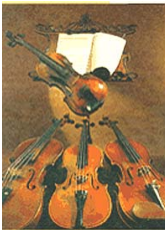
Violine – Viola

.....Die spielerische Talentförderung mit ganzheitlichen Konzepten für Kinder ab 3 Jahren