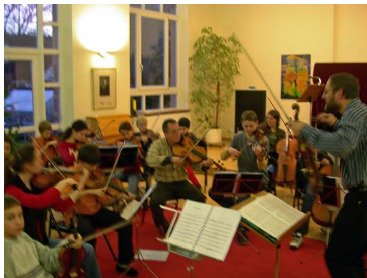
Kammermusik-Workshop-2004 mit Peter Stein/Verdi-Quartett